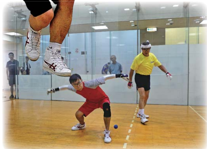
オープンクラス シングルスで年齢を超えた対決風景。(レッドボール)